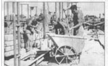
Stručná zkratka příslušníků PTP při výrobě nádob. Orlíká křovina. V době letů byla socialistická metoda práce - vyvádění do tzv. limbových rámců.

V listopadových dnech, kdy si naše národy připomínají události před 15 lety, se v Hradci Králové sešli i národní příslušníci Pomocných technických praporů (PTP) - vojenských táborů nucených prací, aby si znovu přiblížili období svého vojenského zneuznění státní mocí.