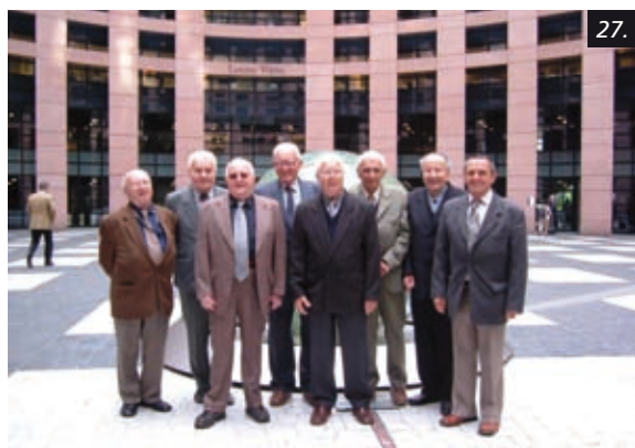
Pétépáci ve Štrasburku – sídle Rady Evropy a EP 5/2010