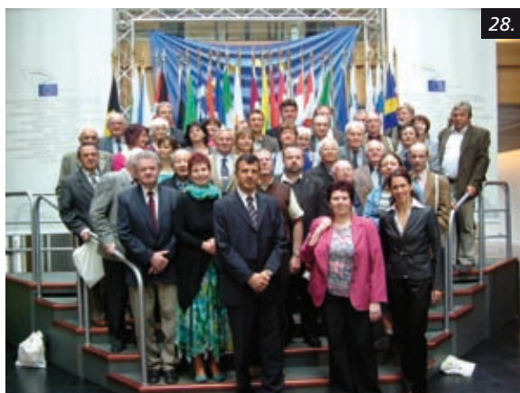
Hradečáci ve Štrasburku v EP s europoslancem O. Vlasákem (v první řadě uprostřed) 5/2010