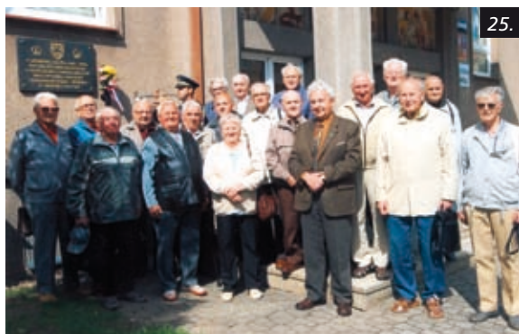
Voj. trubač troubí „ Večerku“ 3. 6. 2009 – pietní vzpomínka „61tníků“