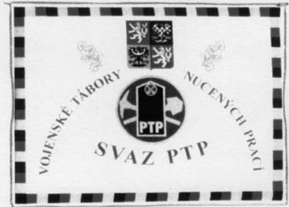
Dnes, jsou příslušníci jednotek PTP jako svaz, součástí třetího odboje vedle členů KPV a ČSBS i příslušníků československé armády.