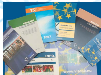
Všechny knížky najdete na www.vlasak.eu