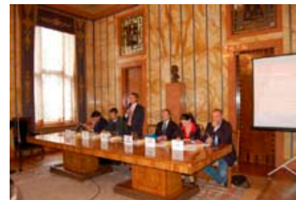
Na prvním snímku starostové měst a obcí Královéhradeckého kraje na Krajském setkání SMO ČR, které se konalo 9. 2. 2009 v Hradci Králové. Na druhém snímku Konference „BESIP ve městech a obcích v zrcadle médií“ - 24. 9. 2009 Praha.