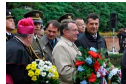
Třetí fotografie – Otvírání budovy VZP v Hradci Králové – 25. 9. 2009. Čtvrtý snímek ze Svatováclavské slavnosti koní – 28. 9. Hradec Králové. Pátý snímek – S Mirkem Topolánkem na letecké show CIAF v Hradci Králové – 5. 9. 2009. Na šesté fotografii pokládání květin k pomníku T.G.Masaryka u příležitosti vzniku republiky – 28.10.